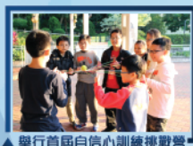
▲ 舉行首屆自信心訓練挑戰營