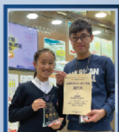
▲ 推薦學生參與九龍城區 傑出學生選舉，並獲得 「初中組傑出學生獎」