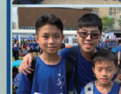
▲ 首次參與香港水足印