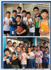
▲ 97.8%學生獲派首三志願