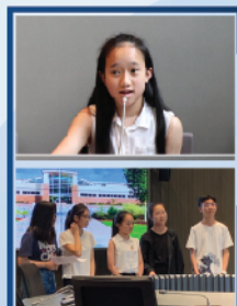
▲ 推薦學生參與領袖訓練課程